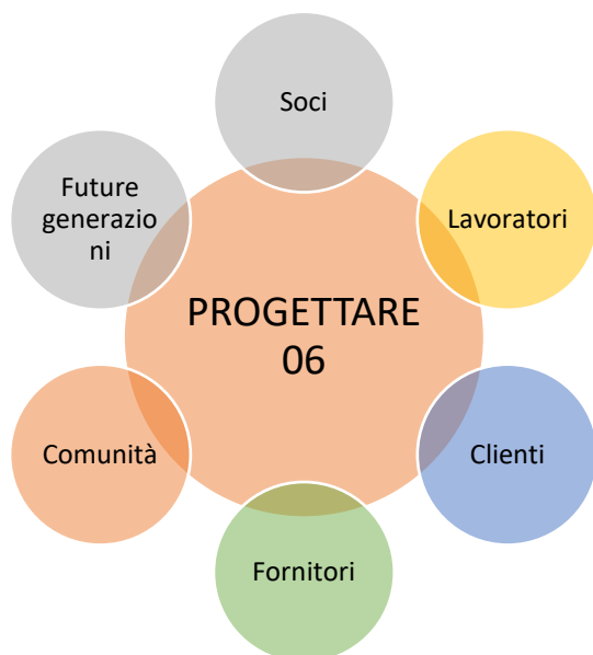
Figura 1: Stakeholders di Progettare 06 identificati nel 2023

Si è utilizzato un management tool, disponibile al sito https://app.bimpactassessment.net/ ed utilizzato da oltre 50.000 aziende in tutto il mondo, tra cui oltre 3.000 B Corp certificate. Tale strumento ci ha consentito una prima autovalutazione circa l'impatto dell'attività su vari stakeholders aziendali identificati nei Soci, nei Lavoratori, nei Clienti, nei Fornitori, nella Comunità e nelle future generazioni.